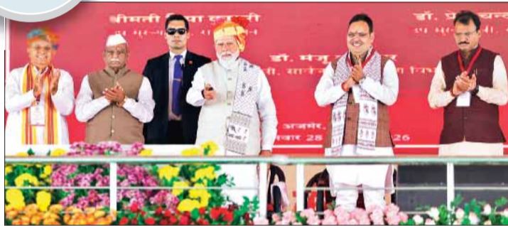
एचपीवी टीकाकरण कार्यक्रम का शुभारंभ करते प्रधानमंत्री मोदी