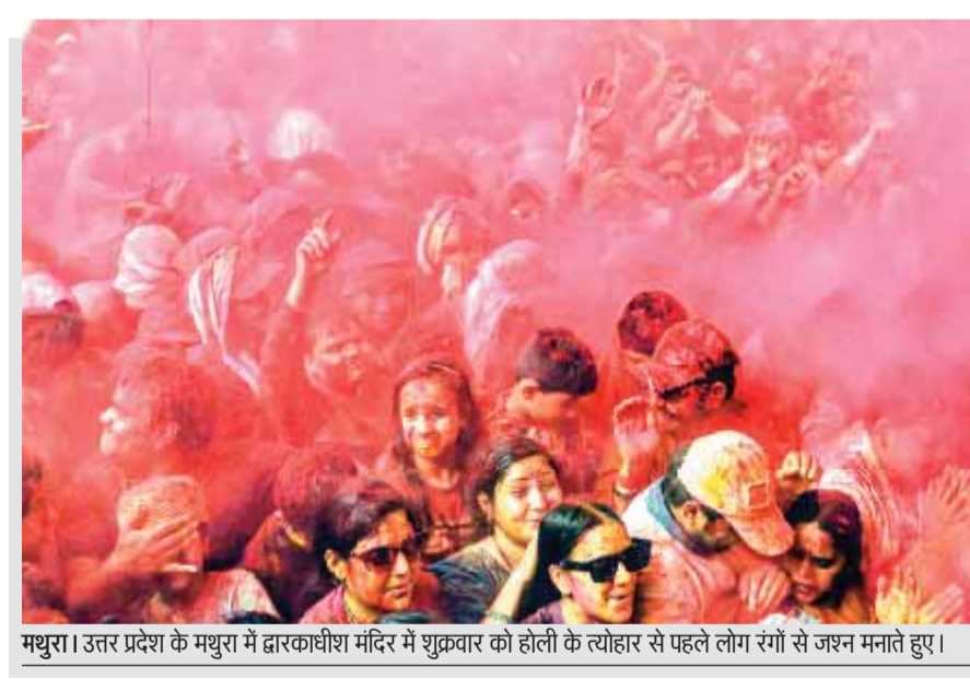
मथुरा। उत्तर प्रदेश के मथुरा में द्वारकाधीश मंदिर में शुक्रवार को होली के त्योहार से पहले लोग रंगों से जश्न मनाते हुए।